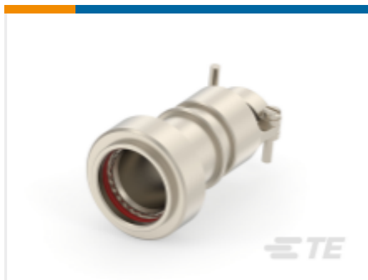
TE 产品编号 37H1-11-06-1-C-L3 37H1-11-06-1-C-L3