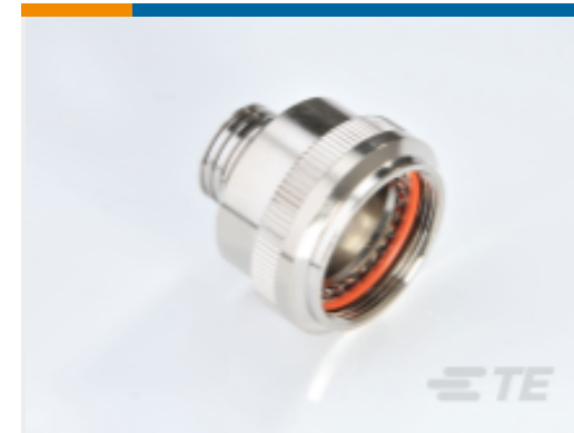
TE 产品编号 EK4773-000 70H1-09-04-1-ZN