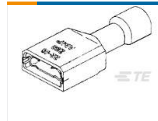
TE 产品编号2-520194-2 ULTRAFAST 187 ASSY REC 22-18 TPBR LP