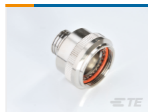
TE 产品编号 70H1-11-09-1-ZN 70H1-11-09-1-ZN