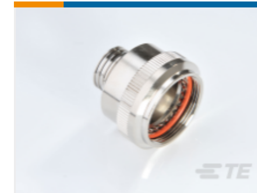
TE 产品编号 70H1-09-05-1-ZN 70H1-09-05-1-ZN