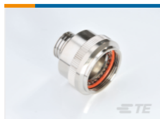
TE 产品编号 70H1-09-09-1-ZN 70H1-09-09-1-ZN