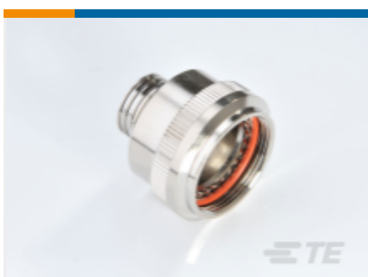
TE 产品编号 70H1-09-07-1-ZN 70H1-09-07-1-ZN