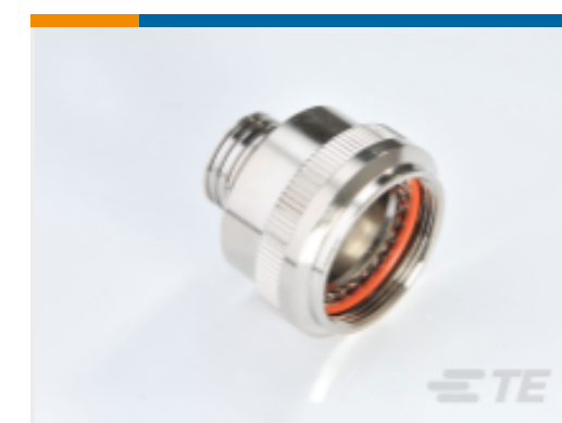
TE 产品编号 70H1-17-09-1-ZN 70H1-17-09-1-ZN