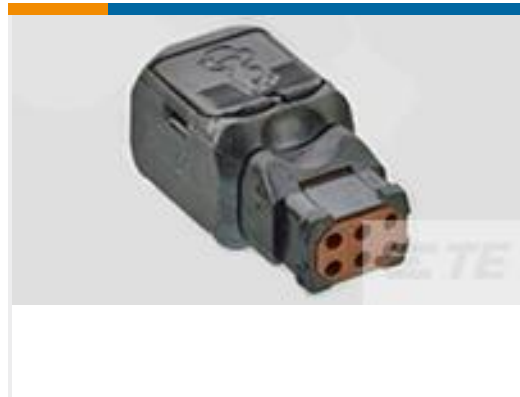
TE 产品编号D369-P66-BP0 369 6 WAY PLUG, NO CONTACTS, PIN