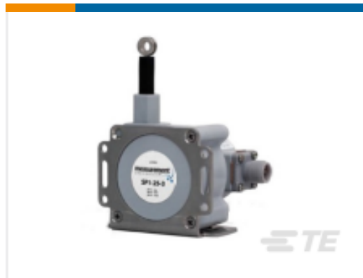
TE 产品编号SP1-4 STRING POT 4.75 INCH RANGE