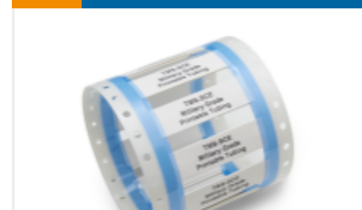
TE 产品编号6315830001 TMS-SCE Military Grade Sleeves