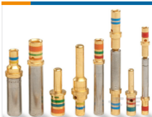
TE 产品编号2562-201-2031L CONT SOC ASSY