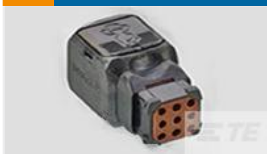
TE 产品编号D369-R99-NS0 369 9 WAY REC, NO CONTACTS, SKT