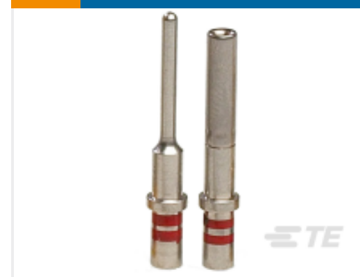
TE 产品编号 ZPF000000000001261 097-0267-16 A1267