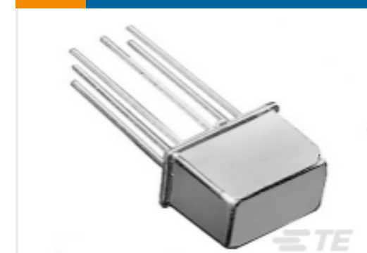
TE 产品编号 1617147-5 JMGAP-26P = M39016/17-030P