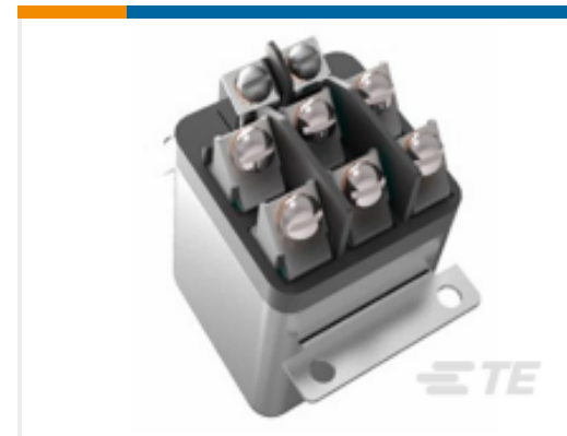
TE 产品编号 1617807-5 FC-335-SY8= RELAY, 3PST