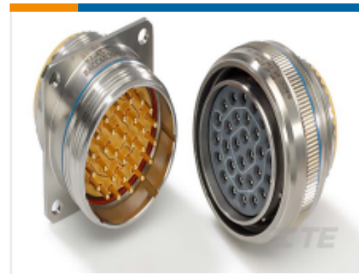
TE 产品编号 ZPF0000000000007174 983-ORS 08-98 PN