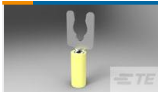
TE 产品编号52924 TERMINAL, PIDG SPR SPD 26-22 6