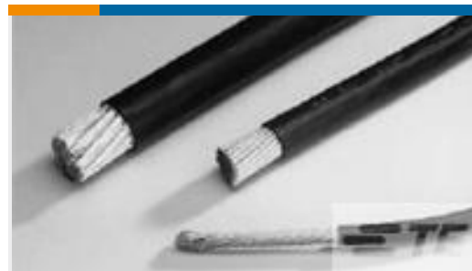
TE 产品编号290091-002 10603-8-0