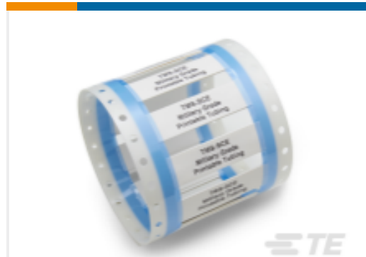
TE 产品编号9422810001 TMS-SCE Military Grade Sleeves