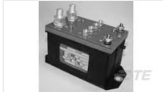
TE 产品编号1616058-6 A703CD (FAA/PMA)=RELAY