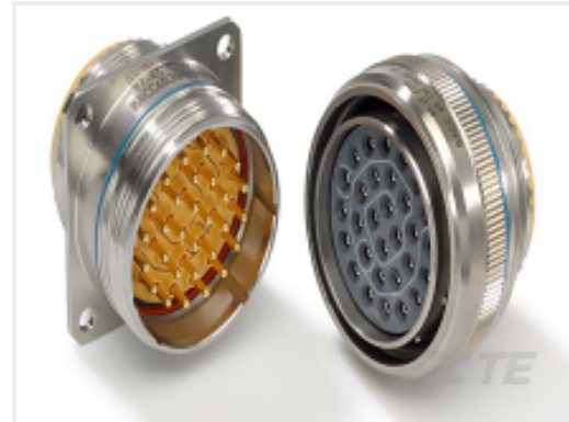
TE 产品编号ZPF000000000007174 983-ORS 08-98 PN