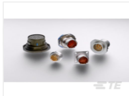
TE 产品编号YDTS20Y13-98XNV001 HERM RECP