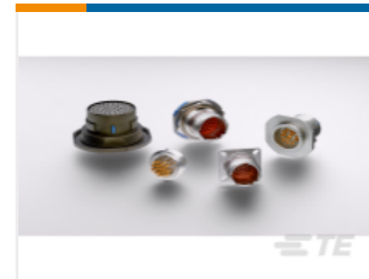
TE 产品编号YDTS20Y13-98XNV001 HERM RECP