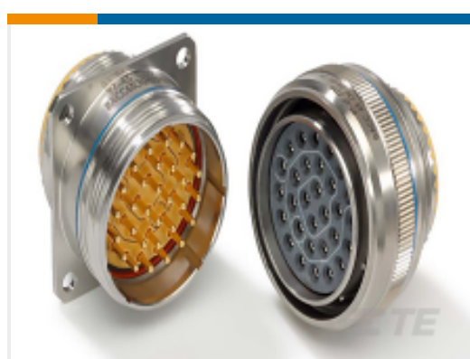
TE 产品编号ZPF00000000000007174 983-0RS 08-98 PN