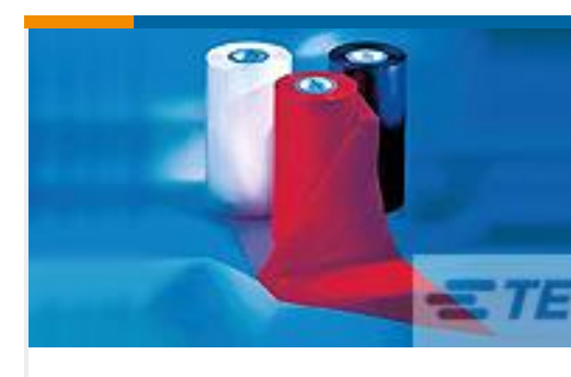
TE 产品编号952888-000 1330-0619-10