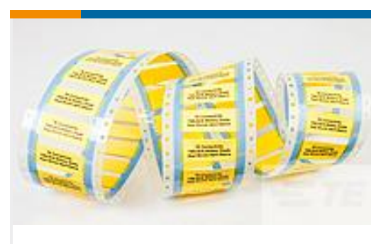
TE 产品编号2410510001 TMS-SCE-1K-3/8-2.0-4