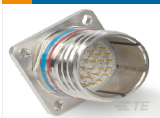
TE 产品编号 CAT-D38999-DTS6Y D38999：方形凸缘，19-32 插件