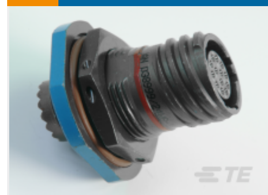
TE 产品编号 CAT-D38999-DTS15O Jam Nut: D38999, 19-32 Insert