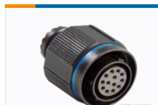
TE 产品编号YDTS26W11-98PNV001 PLUG ASSY