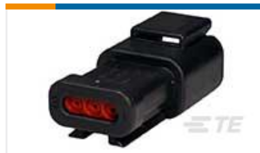
TE 产品编号DTM04-3P-E005 REC, 3P, BLK, N, CAP