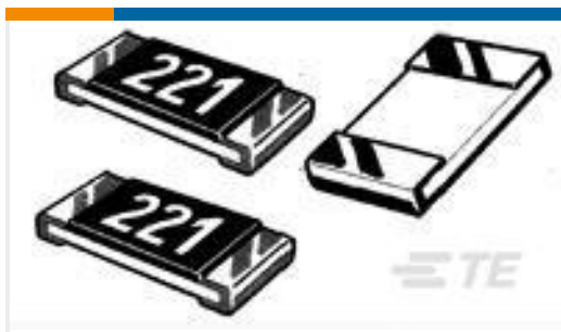
TE 产品编号1-2176070-3 3521 33R 1% 2W