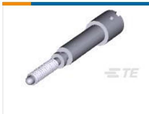
TE 产品编号203618-1 MALE J.S. ASSY. - SHORT