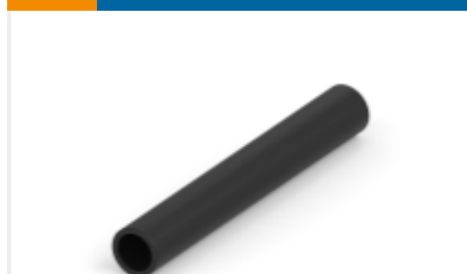
TE 产品编号CX1369-000 BSTS/BSTS-FR 热缩管