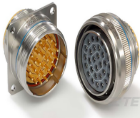
TE 产品编号ZPF0000000000007174 983-0RS 08-98 PN