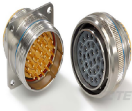
TE 产品编号358279-000 382C312-50-01-0