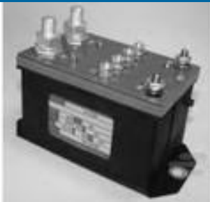
TE 产品编号1616058-6 A703CD (FAA/PMA)=RELAY