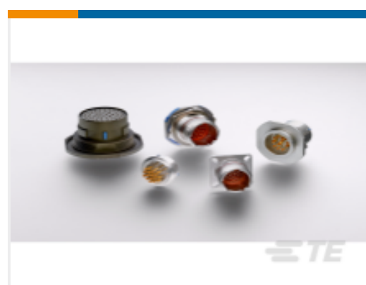
TE 产品编号YDTS20Y13-98XNV001 HERM RECP