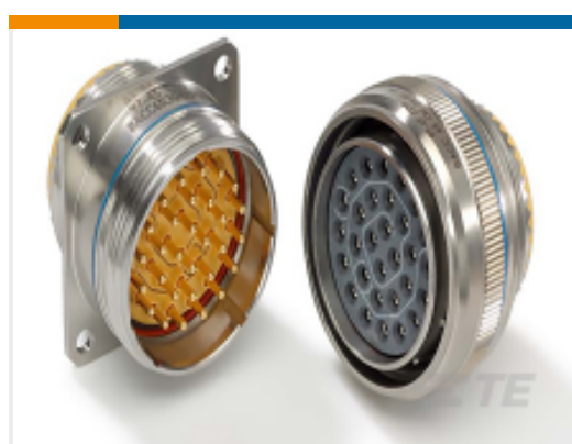
TE 产品编号ZPF0000000000007174 983-ORS 08-98 PN