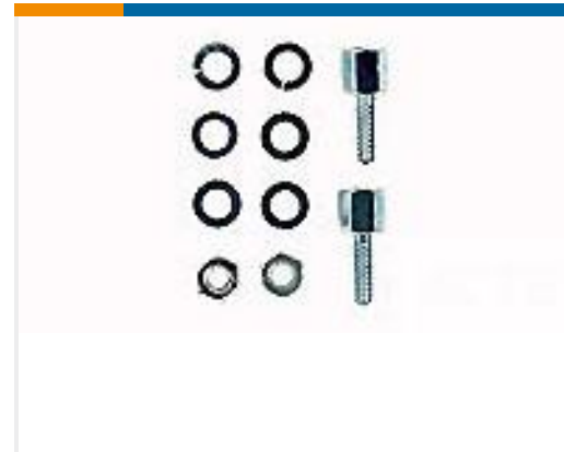
TE 产品编号5207719-3 KIT SCREWLOCK FEMALE CLEAR ZIN