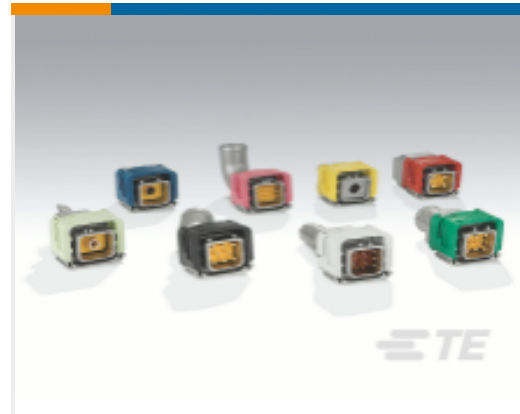
TE 产品编号ZPF000000000100828 Rectangular Connector Plugs, Tool- less Assembly