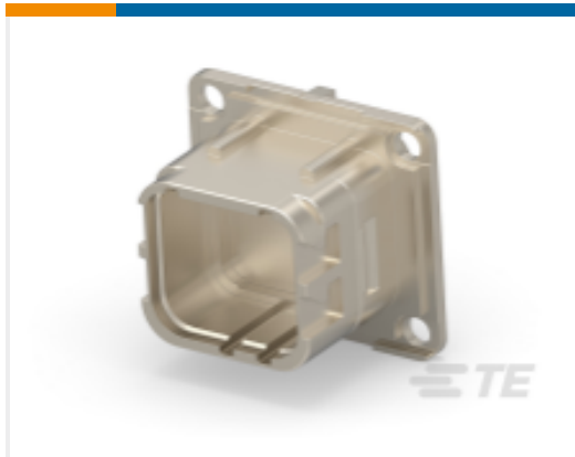
TE 产品编号ZPF000000000105053 Rectangular Connector Receptacles, Tool-less Assembly