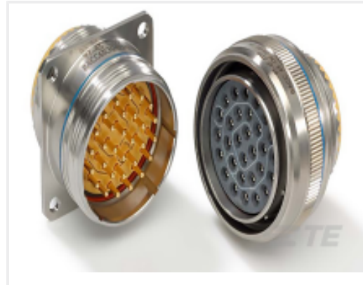
TE 产品编号ZPF000000000007174 983-0RS 08-98 PN