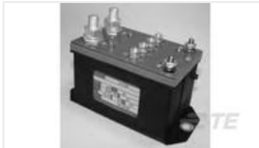
TE 产品编号1616058-6 A703CD (FAA/PMA)=RELAY