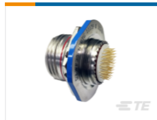
TE 产品编号 YD3JWB05SN2DKG0000 RECP ASSY, 38999 SIII TYPE, PCB MOUNT