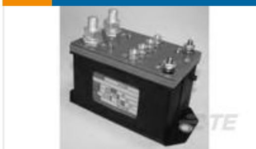
TE 产品编号1616058-6 A703CD (FAA/PMA)=RELAY