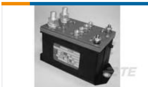
TE 产品编号1616058-6 A703CD (FAA/PMA)=RELAY