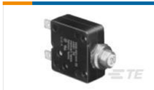
TE 产品编号5-1393249-0 W58-XC4C12A-7=W58