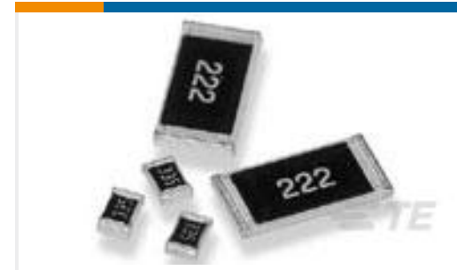
TE 产品编号 1622866-1 CRG0603 1% 1K0