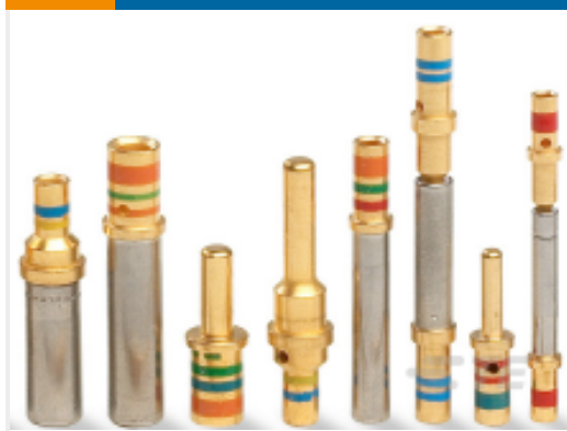
TE 产品编号 38943-20L CONT SOC ASSY