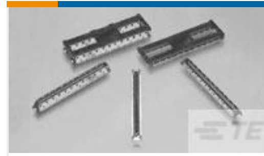
TE 产品编号 3-1827233-6 .5FHP05H,440,B,GIG,08/Sn,HT,NS