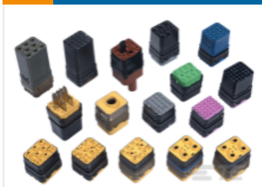
TE 产品编号ZPF000000000015303 DMC-M 20-22 PB