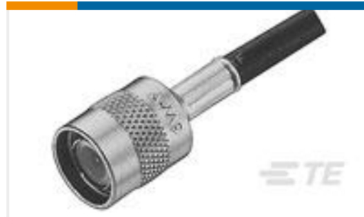
TE 产品编号5225555-6 TNC PLUG DUAL W/P TR