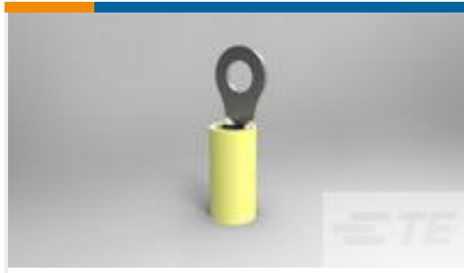
TE 产品编号2-36161-4 TERMINAL,PIDG R IR 10 10