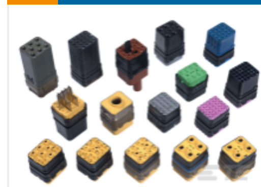
TE 产品编号ZPF000000000015312 DMC-M 20-22 SB