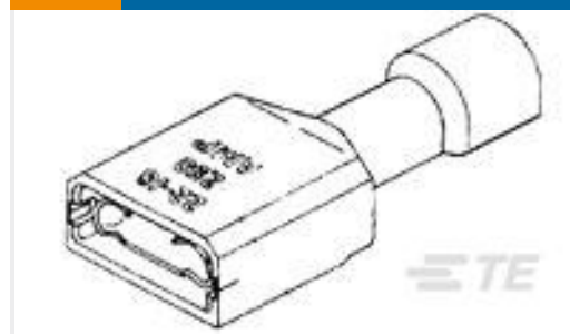
TE 产品编号2-520932-2 ULTRA-FAST .110/.125 ASY REC 22-18 TPBR