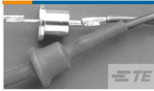
TE 产品编号5677844002 RNF-3000-3/1-9-SP