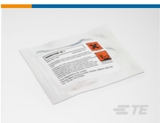
TE 产品编号889431-000 S1264-KIT-1