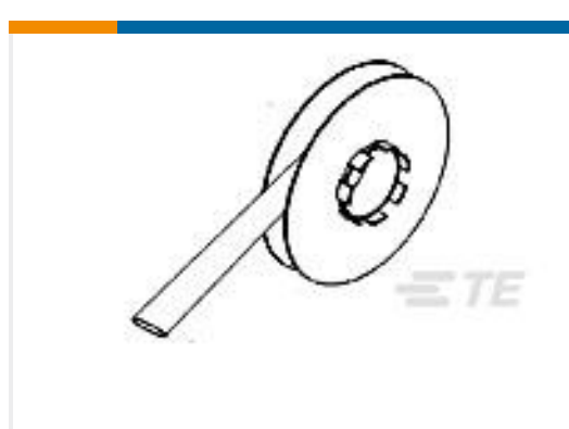
TE 产品编号182794-000 TTMS-19.0-9