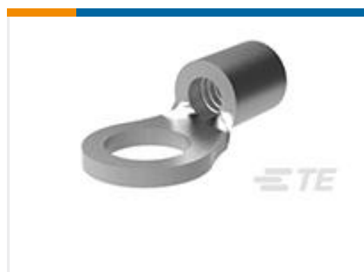
TE 产品编号331401 SOLISTRAND RING 26-22 #6