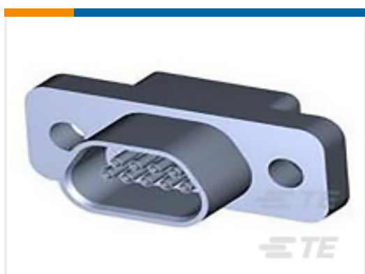
TE 产品编号1532204-1 M83513/02-DN, MCKS-N1-B-25SS