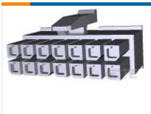
TE 产品编号1-794617-4 14POS,MICRO MNL,RCPT HSG