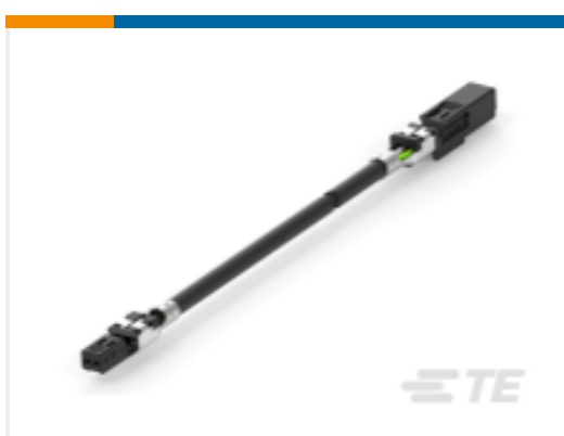
TE 产品编号2362767-4 MATENET,CABLE ASSY,1 GBPS UTP