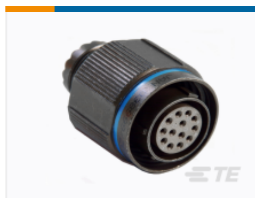
TE 产品编号YDTS26W19-32PAV001 PLUG ASSY