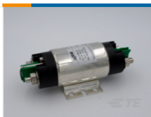
TE 产品编号K1021599 Relay 29-221-12