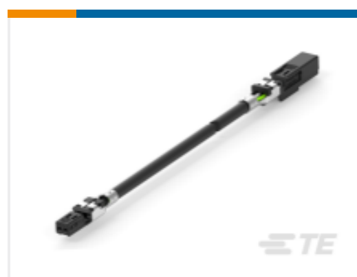
TE 产品编号2362767-2 MATENET,CABLE ASSY,1 GBPS UTP