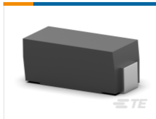
TE 产品编号 3-2176459-6 SMW 7W 3R0 5% Taped