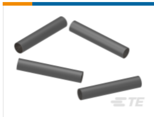
TE 产品编号 NB25822001 SCL-1/8-0-STK