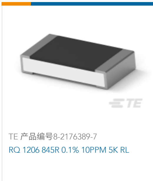
TE 产品编号 8-2176389-7 RQ 1206 845R 0.1% 10PPM 5K RL