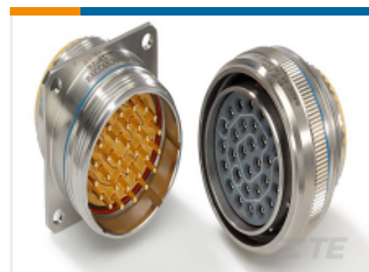
TE 产品编号ZPF0000000000007174 983-0RS 08-98 PN