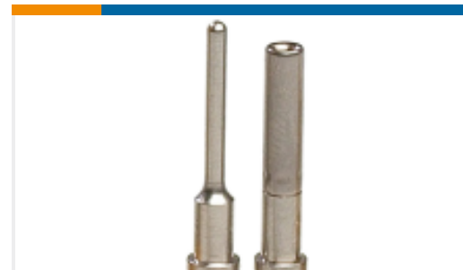
TE 产品编号ZPF000000000001261 097-0267-16 A1267