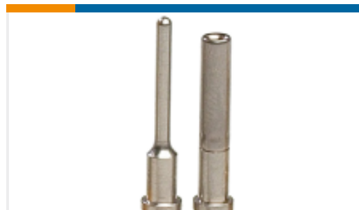
TE 产品编号ZPF000000000001261 097-0267-16 A1267