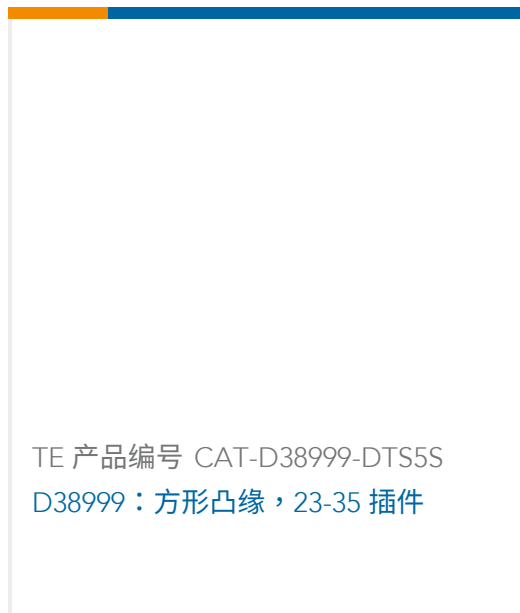
TE 产品编号 CAT-D38999-DTS5S D38999：方形凸缘，23-35 插件