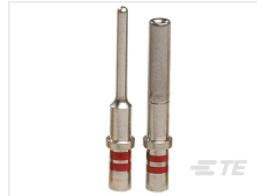
TE 产品编号 ZPF000000000001261 097-0267-16 A1267