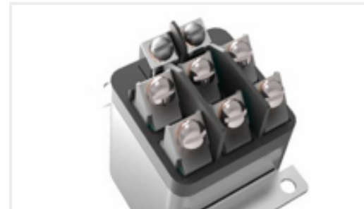
TE 产品编号 1617807-5 FC-335-SY8= RELAY, 3PST