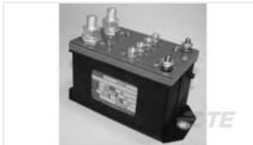
TE 产品编号 1616058-6 A703CD (FAA/PMA)=RELAY