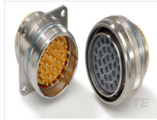
TE 产品编号 ZPF000000000007174 983-0RS 08-98 PN