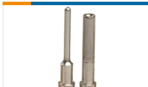
TE 产品编号 ZPF000000000001261 097-0267-16 A1267