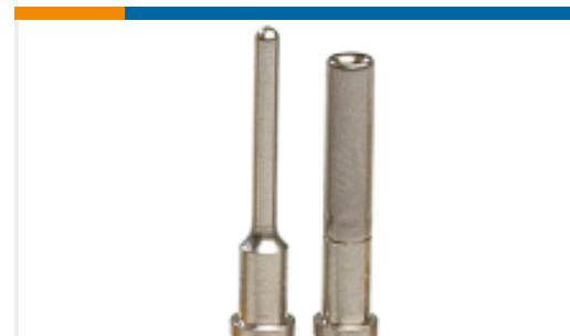
TE 产品编号 ZPF000000000001261 097-0267-16 A1267