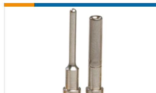
TE 产品编号 ZPF000000000001261 097-0267-16 A1267