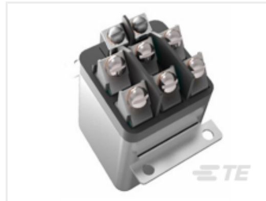
TE 产品编号 1617807-5 FC-335-SY8= RELAY, 3PST