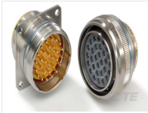
TE 产品编号 ZPF000000000007174 983-ORS 08-98 PN