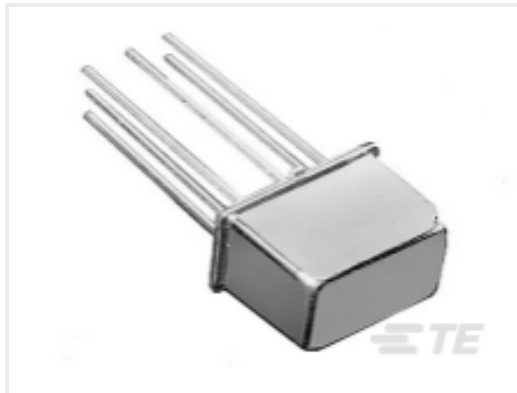
TE 产品编号 1617147-5 JMGAP-26P = M39016/17-030P