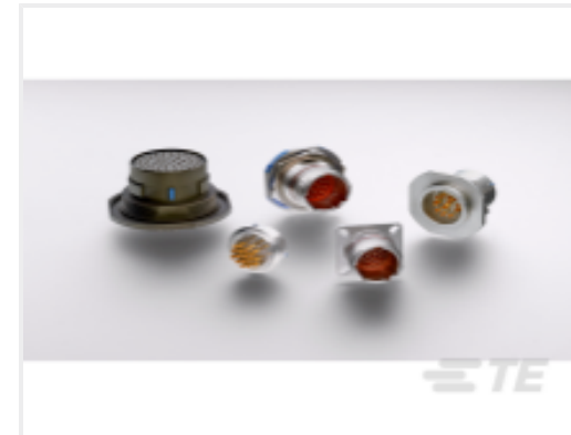
TE 产品编号 YDTS20Y13-98XNV001 HERM RECP