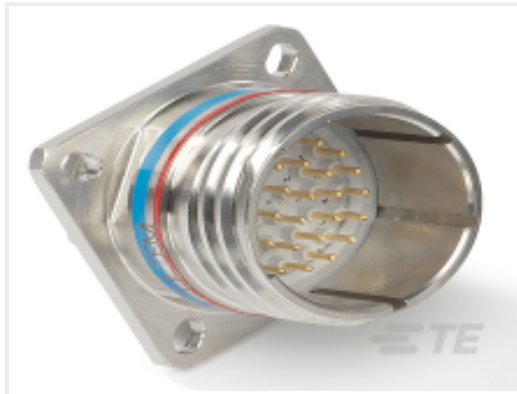
TE 产品编号 YDTS20T17-26BDV001 RECP ASSY