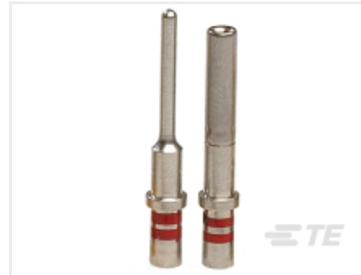
TE 产品编号 ZPF000000000001261 097-0267-16 A1267