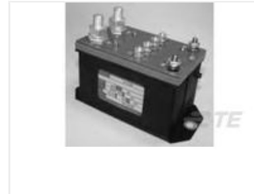
TE 产品编号 1616058-6 A703CD (FAA/PMA)=RELAY