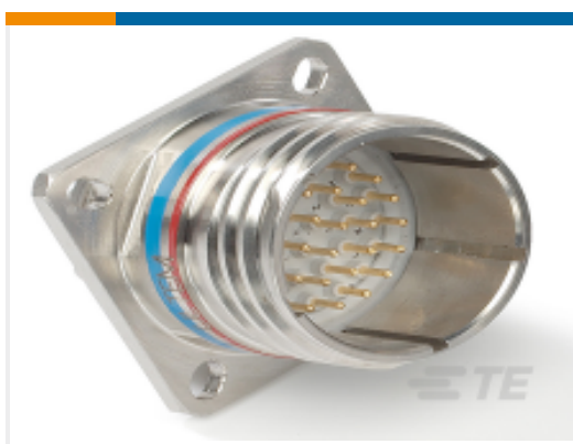
TE 产品编号 CAT-D38999-DTS4N D38999: Square Flange, 11-05 insert