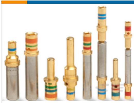
TE 产品编号2562-201-2031L CONT SOC ASSY