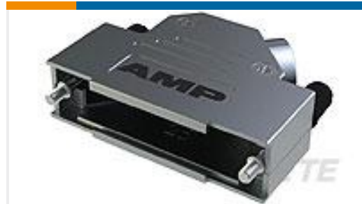
TE 产品编号5-1478763-1 Metal backshell 9 way 45 Deg E