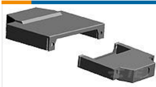
TE 产品编号5788362-1 .8MM CHAMP BACKSHELL KIT