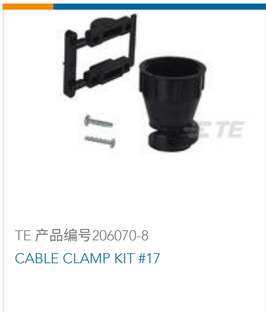
TE 产品编号206070-8 CABLE CLAMP KIT #17