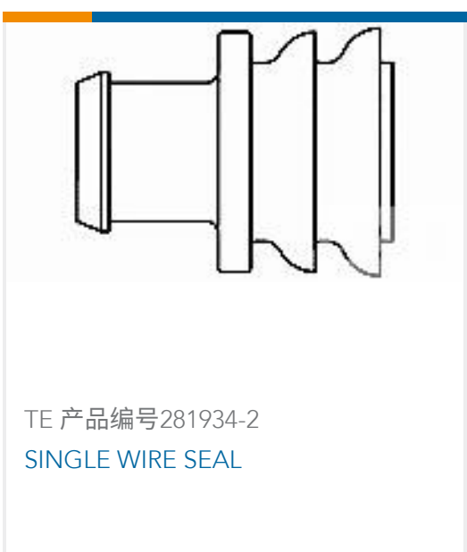
TE 产品编号281934-2 SINGLE WIRE SEAL