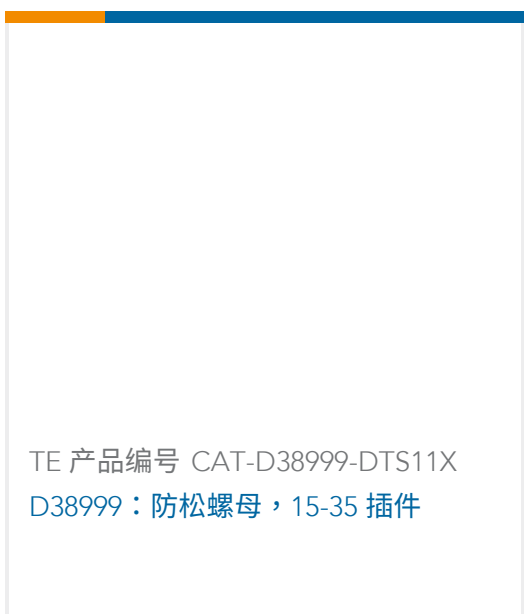
TE 产品编号 CAT-D38999-DTS11X D38999: 防松螺母, 15-35 插件