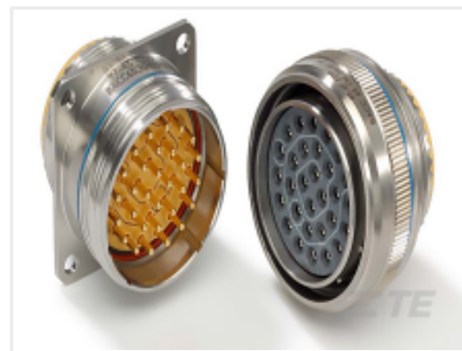
TE 产品编号ZPF000000000007174 983-ORS 08-98 PN