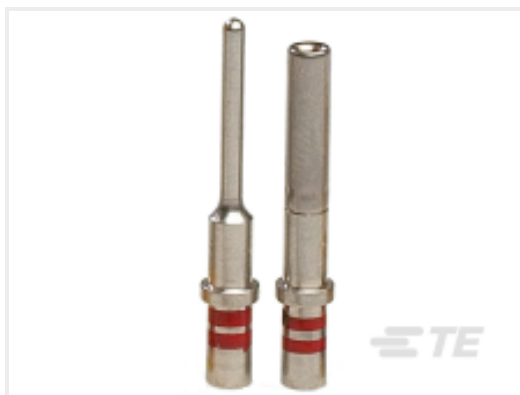
TE 产品编号ZPF000000000001261 097-0267-16 A1267