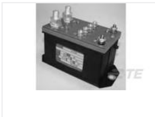
TE 产品编号1616058-6 A703CD (FAA/PMA)=RELAY