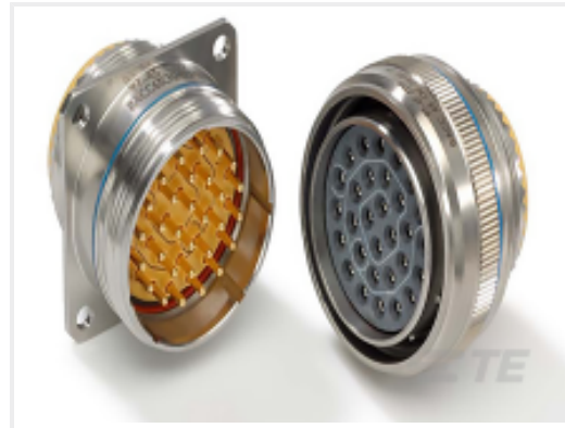
TE 产品编号ZPF000000000007174 983-0RS 08-98 PN