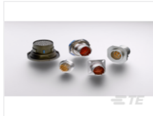
TE 产品编号YDTS20Y13-98XNV001 HERM RECP