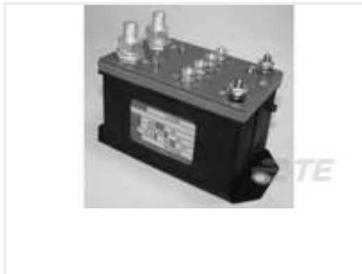
TE 产品编号1616058-6 A703CD (FAA/PMA)=RELAY