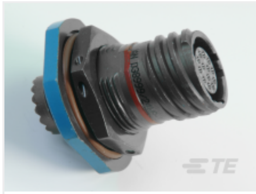
TE 产品编号 CAT-D38999-DTS11F D38999: Jam Nut, 25-37 Insert, Electroless Nickel Plating