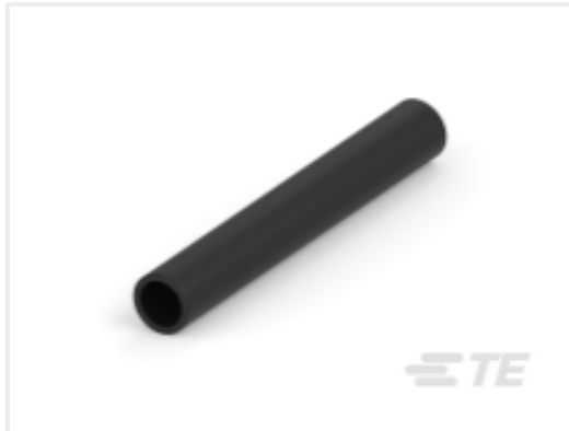
TE 产品编号CAT-HST-BSTS BSTS/BSTS-FR 热缩管