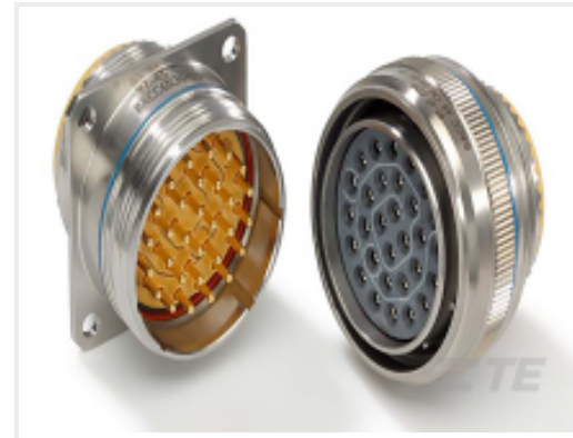
TE 产品编号 ZPF0000000000007174 983-0RS 08-98 PN