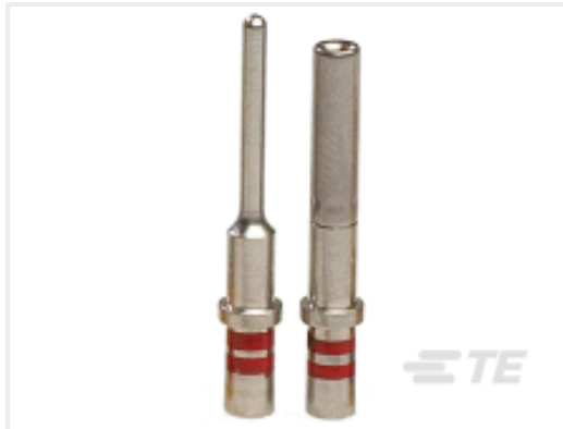
TE 产品编号 ZPF000000000001261 097-0267-16 A1267