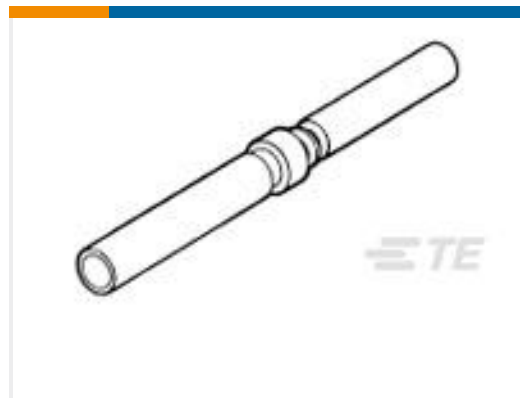
TE 产品编号206071-1 SZ 22, SOCKET, NON-MAG