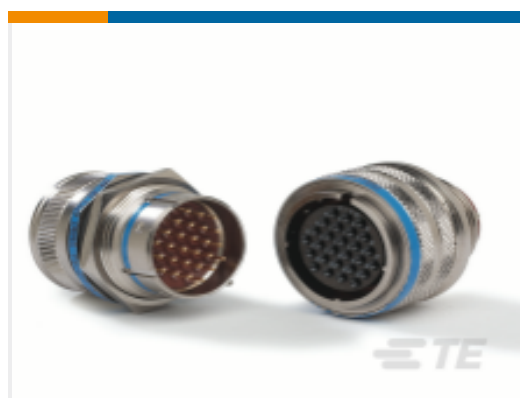
TE 产品编号ZPF00000000013276 DBAS 76-37-0 SN 059