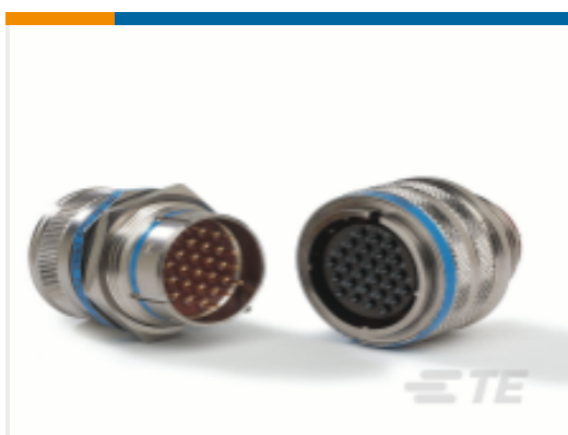
TE 产品编号ZPF00000000012990 DBAS 74-37-0 PN 059