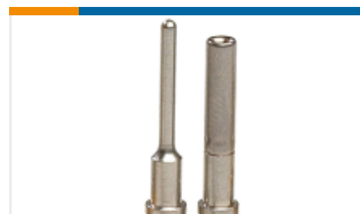
TE 产品编号ZPF000000000001261 097-0267-16 A1267