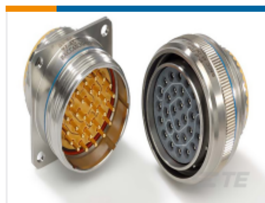
TE 产品编号ZPF0000000000007174 983-0RS 08-98 PN