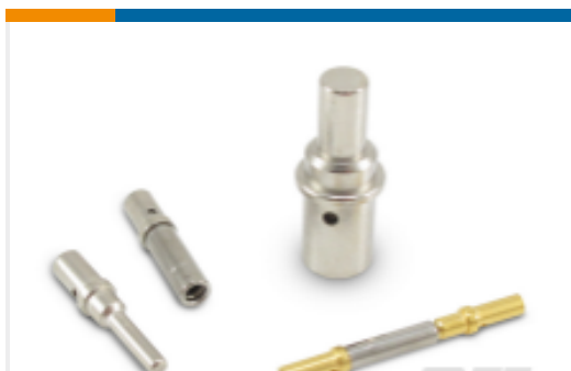
TE 产品编号0460-202-16141 DEUTSCH Solid Contacts