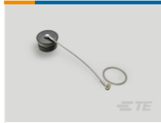
TE 产品编号 YDTS32F21NV0010000 DUST COVER ASSEM