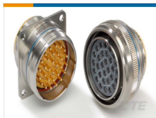
TE 产品编号ZPF00000000000007174 983-ORS 08-98 PN