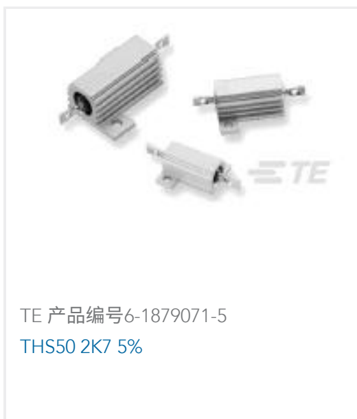
TE 产品编号6-1879071-5 THS50 2K7 5%