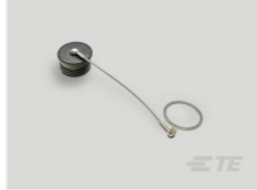
TE 产品编号 YDTS32W21RV0010000 DUST COVER ASSEM