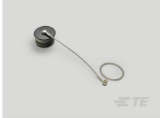
TE 产品编号 YDTS32T21RV0010000 CAP ASSEMBLY