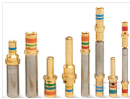
TE 产品编号38941-22L CONTACTS