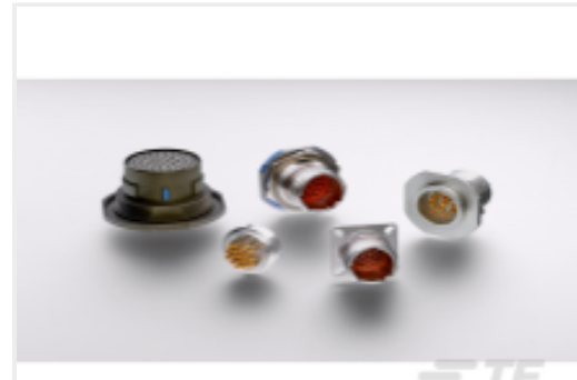
TE 产品编号 YDTS20N21-11SNV001 HERM RECP