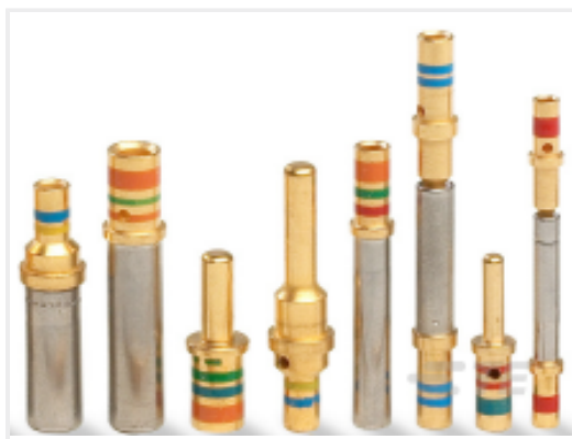
TE 产品编号2562-201-2031L CONT SOC ASSY