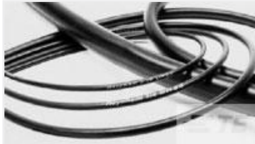
TE 产品编号5039294018 DR-25-3/16-0-SP