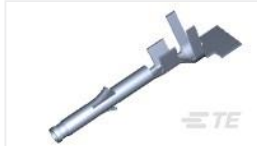
TE 产品编号171639-1 MINI U-M-N-L SOCKET L.P