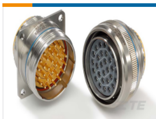
TE 产品编号ZPF0000000000007174 983-0RS 08-98 PN