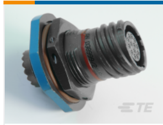
TE 产品编号 CAT-D38999-DTS10L D38999: Jam Nut, 19-32 Insert, Electroless Nickel Plating