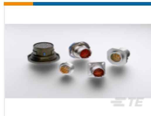
TE 产品编号 YDTS21H19-32DAV001 HERM RECP