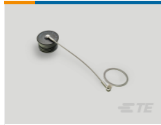
TE 产品编号 YDTS32F19NV0010000 DUST COVER ASSEM