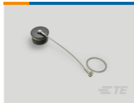
TE 产品编号 YDTS32W19NV0010000 DUST COVER ASSEM