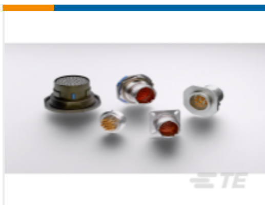
TE 产品编号 YDTS21H19-32ZAV001 HERM RECP