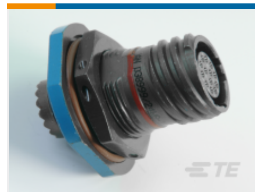
TE 产品编号 CAT-D38999-DTS10K D38999: Jam Nut, 19-11 Insert, Electroless Nickel Plating