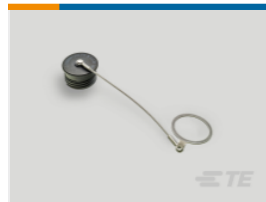
TE 产品编号 YDTS32F19NV0010000 DUST COVER ASSEM