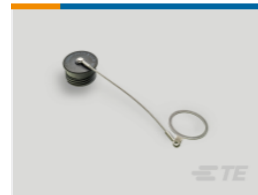
TE 产品编号 YDTS32W19RV0010000 DUST COVER ASSEM